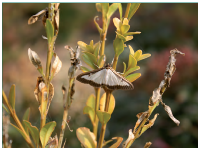
Figura 1. Cydalima perspectalis : adulto

Gli adulti di C. perspectalis sono farfalle caratterizzate da ali bianche munite di una evidente fascia marrone distale; l'apertura alare può raggiungere i 40 mm. Della specie esiste anche una forma melanica, caratterizzata da una colorazione alare marrone. Le uova, deposte dopo l'accoppiamento, sono inizialmente di colore giallo chiaro, ialino; in seguito compare una macchia scura corrispondente al capo nero della larva in fase di sviluppo. Appiattite e di forma tondeggianti, con diametro di 0,8-1,0 mm, le uova sono deposte, parzialmente sovrapposte in ovoplacche di circa 15-20 elementi, sulla pagina inferiore delle foglie. In presenza di temperature miti lo sviluppo larvale è veloce, dopo 2-3 giorni dall'ovodeposizione le larve di prima età, lunghe 1,5 mm circa e di colore giallo con capo nero, iniziano già a fuoriuscire dalle uova. Esse iniziano a nutrirsi in