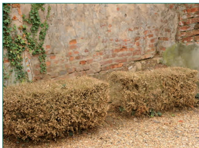
Foto 7. Siepe completamente disseccata