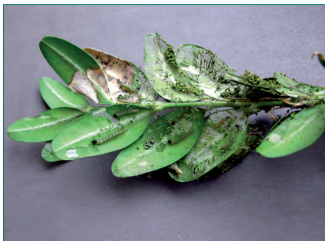
Figura 3. Erosioni e scheletrizzazione delle foglie causate da larve di 3ª età

forma gregaria sulla pagina inferiore delle foglie, risparmiando solo l'epidermide superiore. A partire dalla terza età, i bruchi si nutrono dell'intera foglia, rispettandone solo le nervature (aspetto "scheletrizzato"), tessendo fili sericei con cui le avvolgono fino a formare dei nidi al cui interno si riparano e dove, in seguito, si incrisalideranno. Le larve più sviluppate divorano l'intera lamina fogliare e intaccano anche la corteccia dei rametti. Le crisalidi, lunghe circa 20 mm, sono di colore dapprima verde chiaro, poi bruno. Complessivamente lo sviluppo avviene attraverso 5 o 6 stadi larvali, con individui via via più grandi e caratterizzati da una colorazione più intensa, con tinta di fondo giallo verde e bande laterali brune, fino a raggiungere 35-38 mm di lunghezza. Il capo, nero lucente, presenta un caratteristico disegno bianco a forma di epsilon.