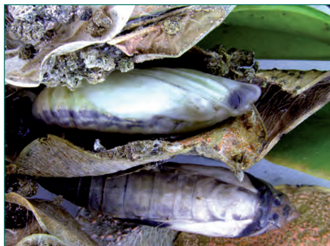
Foto 5. Crisalidi

Lo sviluppo di più generazioni e l'elevato numero di uova deposte, in assenza di limitatori naturali specifici, consente lo sviluppo di attacchi molto intensi a carico della pianta ospite. Nell'arco di pochi giorni intere siepi possono disseccare in conseguenza dell'attività trofica delle larve, passando dal caratteristico colore verde intenso a una desolante colorazione marrone, con presenza abbondante nel fogliame dei diversi stadi della farfalla, deiezioni larvali e teli sericei. Considerato che il bosso è utilizzato principalmente a scopo ornamentale, è chiaro che anche le fasi iniziali degli attacchi, con la comparsa di chiazze di vegetazione disseccate, diminuiscono notevolmente il valore estetico delle formazioni realizzate con questa essenza. Essendo inoltre una pianta a lenta crescita, risulta molto difficile il recupero di siepi sottoposte a tagli di rimonda delle parti disseccate.