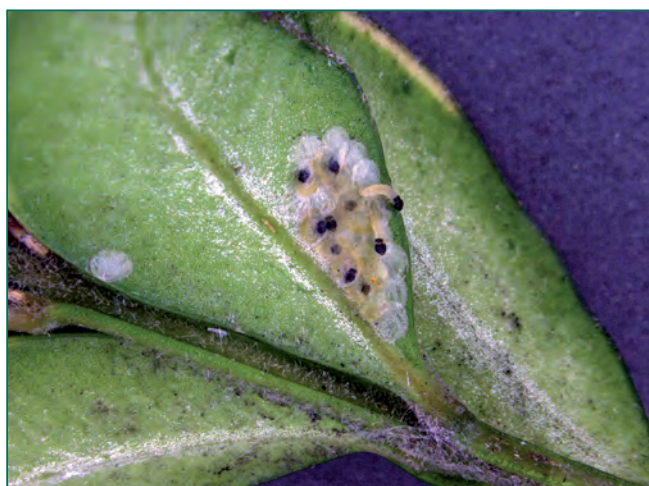
Figura 2. Ovatura e larve neogusciate