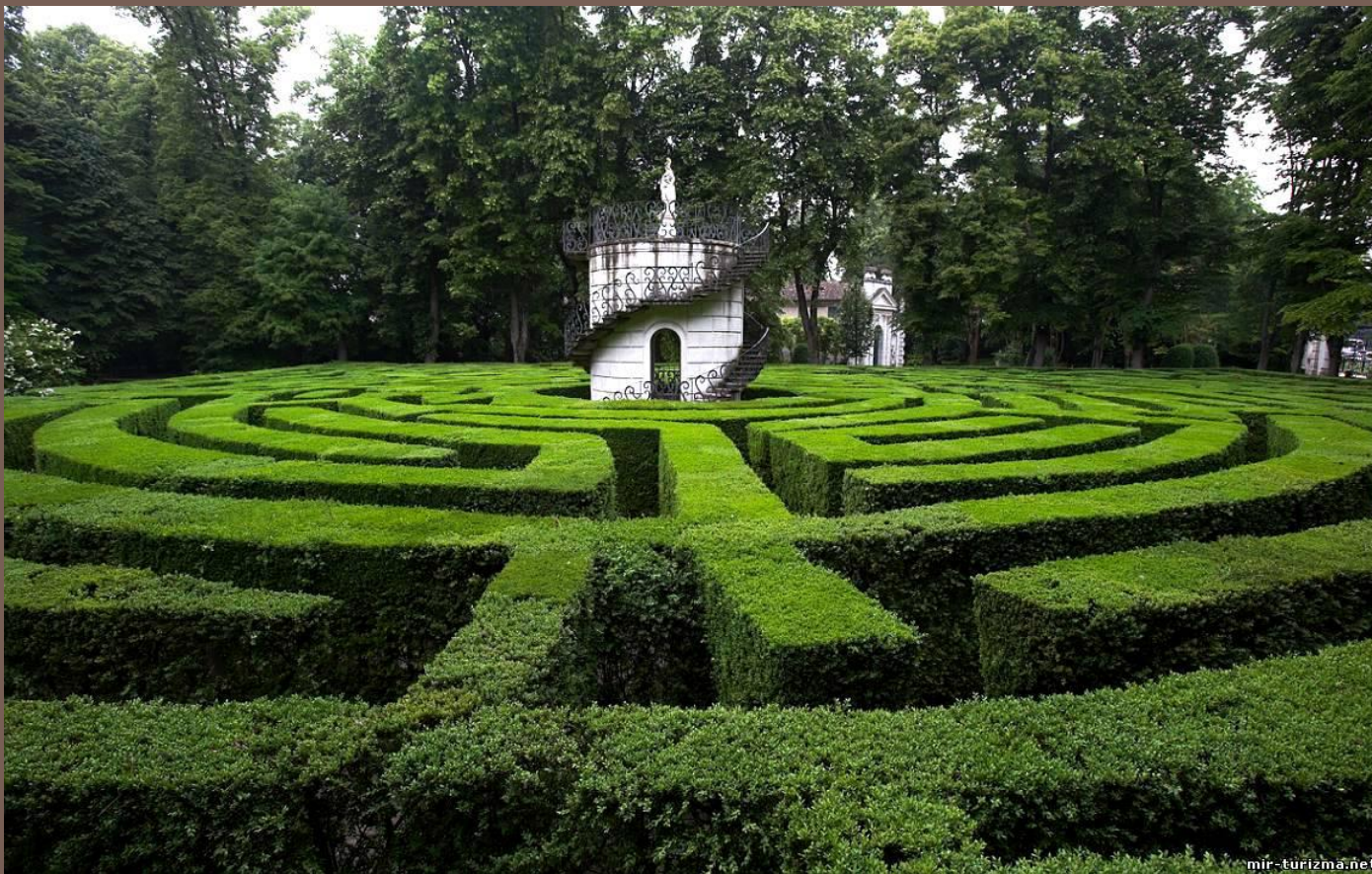
Labirinto di villa Pisani, Stra, Venezia

La preoccupazione maggiore riguarda ovviamente le siepi storiche dei giardini all'italiana.